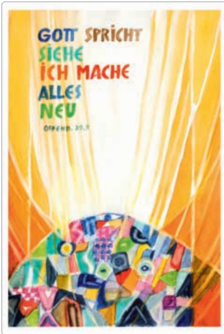
Andreas Felger - Offenbarung 21,5 (Jahreslosung 2026) Aquarell auf Papier - © Andreas Felger Kulturstiftung

Der in Süddeutschland beheimatete Künstler Andreas Felger hat auch diesmal die Jahreslosung wieder in einem sehr bunten Bild zum Ausdruck gebracht. Das Ganze (Alles) erscheint wie in bunten Mosaiksteinchen auf einer Schubkarre oder einem Teller dem Licht entgegengehalten. Im Einzelnen erkenne ich ein Haus und ein Auge (Siehe!), jede Menge Stückwerk, nicht unbedingt dunkel oder zerstört, aber ein gewaltiges Sammelsurium oder Puzzle.